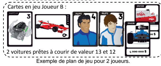
Exemple de plan de jeu pour 2 joueurs.